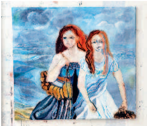
SOMMARMOTIV. Målningen Två systrar ska visas i Paris.

Isæus-Berlins ateljé för att välja målningar till en utställning. Den 27 maj är det vernissage i Paris. Klart är att Meta Isæus-Berlin ska visa sex nya verk ihop med några målningar av 1900-talsmåleriets stora namn, EDVARD MUNCH . Följdriktigt får utställningen namnet Lumière du Nord , Nordens ljus.